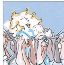
Trovare aiuto per essere sostenuti 寻找帮助和支持。 Find help and get support ابجد المساعدة و الدعم मदद के लिए मदद ढूंढो। Găsește ajutor pentru a fi susținută