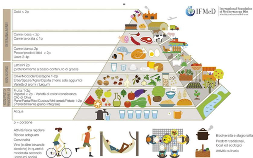
Fig. 1 Piramide Alimentare Mediterranea

La Dieta mediterranea è basata su un consumo di quantità moderate di cibo, come rappresentato nella Piramide alimentare (Fig. 1), formata da più sezioni contenenti i vari gruppi alimentari. Ciascun gruppo deve essere presente in modo proporzionale alla grandezza della sezione. Alla base si trovano gli alimenti, che si possono assumere più liberamente tutti i giorni; mentre al vertice sono presenti gli alimenti, che si devono limitare nell'arco della settimana, anche nelle quantità.