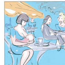
Potete allattare ed essere bene accolte ...ovunque 可以在任何场所母乳喂養，并深受好评...任何地方。 Able to breastfeed and be welcomed ...everywhere بمكانك ارضاع ابنك و الترحيب بكما ... في أي مكان. स्तनपान को सर्वत्र स्वागत करने में सक्षम। A putea alăpta și a fi bine văzute ...oriunde

benvenuta mamma nelle nostre sedi trovi confort e disponibilità, se preferisci un luogo riservato chiedi agli operatori