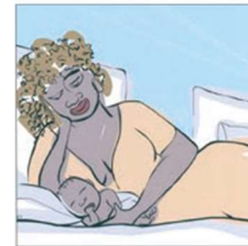
Stare sempre insieme... 永远在一起 ... You and your baby together... البقاء معا دائما ... हूमेना एक साथ होना... Rămâneți mereu împreună...