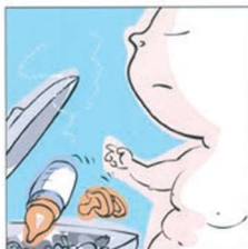
...senza interferenze ...无干扰。 ...without any interference ...عدم تدخل الجهات و الرضعات الاصطناعية. हस्तक्षेप के बिना.... ...fără intermediari