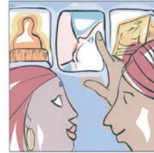
Scegliere informati 知识和选择。 The right to choose اختيار من لديهم علم و خبرة. अपनी जरूरत के अनुसार जानकारी सेना। Alegeți în mod informat