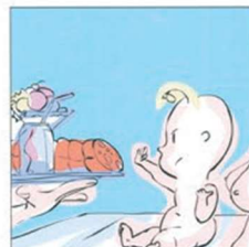
Allattare esclusivamente per 6 mesi e poi ...continuare 母乳喂养 6 个月... 然后继续。 Exclusive breastfeeding for 6 months and then ...continue it ارضعي طفلك فقط حليبك لمدة ستة أشهر... بعد ذلك اعطي المولود الاغذية. बिना किसी अन्य स्तनपान के 6 महीने के लिए और फिर इसे जारी रखना। Alăptează în mod exclusiv în primele 6 luni și după ...nu ezita să continui