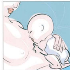
Allattare ...naturalmente 母乳喂养...是自然的。 Breastfeeding ...naturally ارضعي طفلك ...رضاعة طبيعية. स्वभाव से स्तनपान। Alăptează ...natural