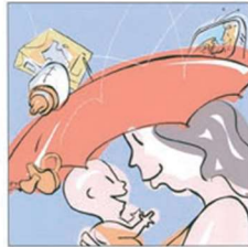
Essere protetti dalla pubblicità 被保护的宣传。 Protected from advertising الحماية من الإعلانات. प्रचार से बाकिफ होने के लिए। Protejați de publicitate