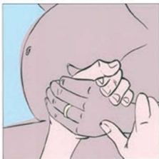
Partorire secondo natura 自然分娩。 Natural childbirth الولادة الطبيعية. प्रसाव के प्राकृतिक विधि। Nașterea: un proces natural