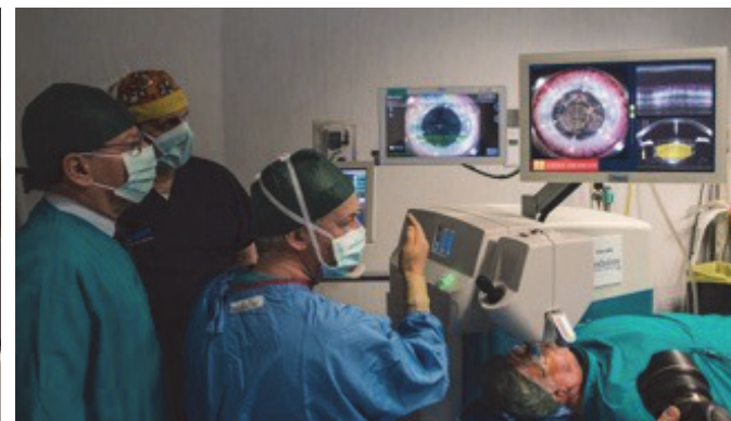
Nella foto: Femtolaser in uso donato da Fondazione CRT alla Clinica Oculistica di ASUITS

Solo per citarne alcune, si ricordano nel 2016 la donazione del Laser al Tullio, strumento più efficace e meno invasivo per il trattamento della ipertrofia prostatica benigna (IPB), un innovativo sistema di cardiangiografia unico in Italia a elevatissima qualità d'immagine destinato alla nuova e modernissima sala di