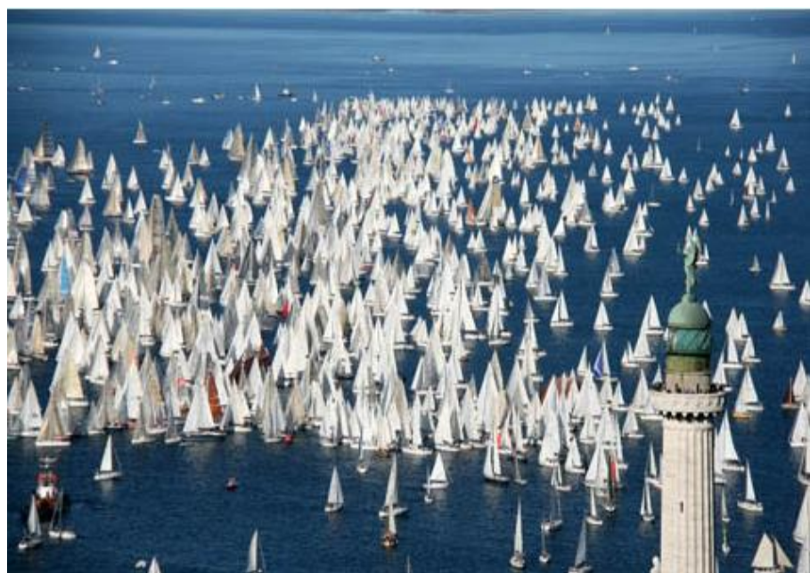
Trieste città della BARCOLANA