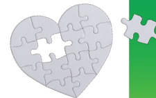
TAVOLA ROTONDA 1: RISCHIO CV ED IPERCOLESTEROLEMIA

Impatto dell'innovazione sulla riorganizzazione dei servizi e la semplificazione dei percorsi di cura